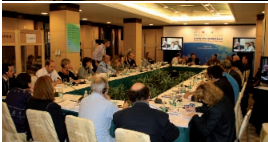
Réunion des Secrétariats des commissions et des Sections de CGLU.