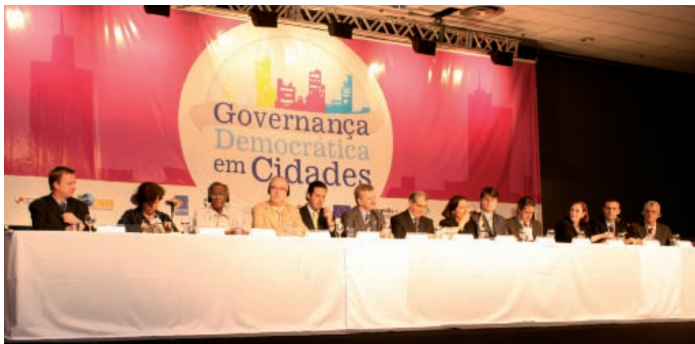
Cérémonie d'ouverture du Symposium sur la gouvernance démocratique dans les villes.

La première réunion de la Commission 3 sur le thème de la gouvernance urbaine intégrée a eu lieu les 24 et 25 novembre à Porto Alegre, à l'occasion d'un colloque sur la gouvernance démocratique dans les villes qui a aussi permis aux participants d'échanger leurs vues sur l'innovation urbaine et la démocratie participative. Plus de 700 personnes ont assisté au colloque et provenaient de villes et institutions aussi diverses que Bamako, Barcelone, Belo Horizonte, Rosario, Salvador, Sao Paulo, Berlin, Edinbourg, Etat de Mexico, Katmandou, Porto Alegre, Rome, Melbourne, UNDESA, UNESCO et CISCO Systems.