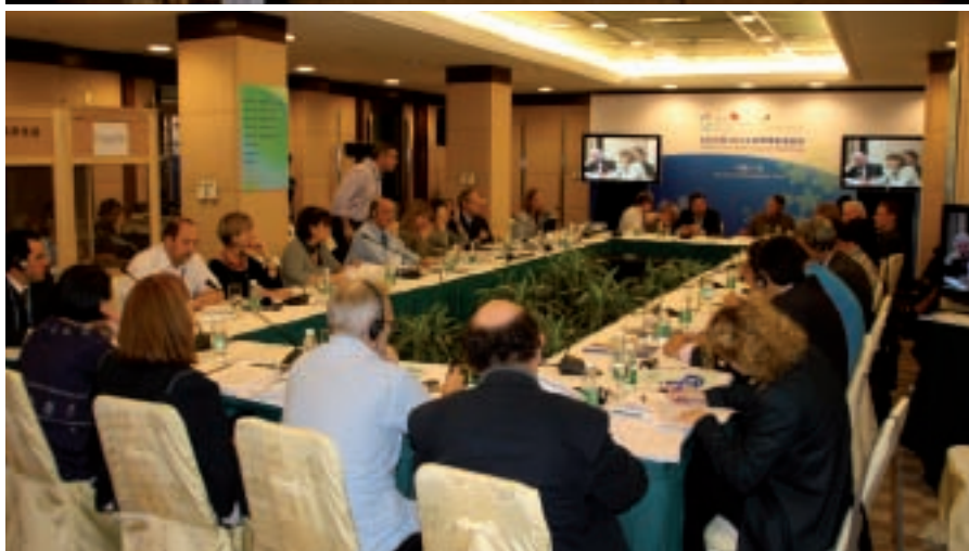
Reunión de los Secretariados de Comisiones y de las Secciones de CGLU.