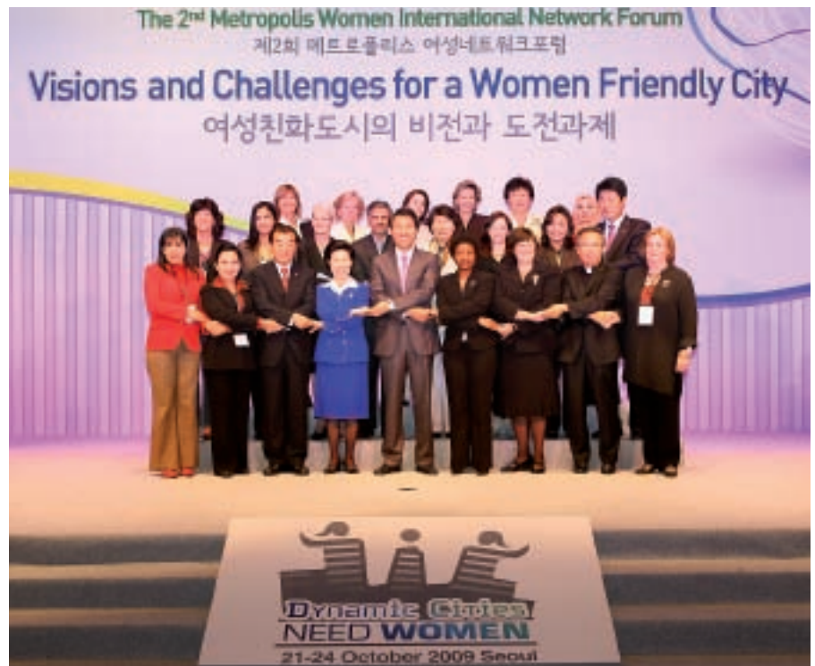
El Alcalde de Seúl, junto a las principales responsables de la Red de Mujeres de Metropolis.

El Foro concluyó con la aprobación de la Declaración de Seúl, firmada en un acto protocolario por la presidenta de la Red Internacional de Mujeres de Metropolis y la copresidenta del II Foro Internacional de Mujeres, así como las representantes de las distintas antenas de la Red de Mujeres. Una Declaración que ya ha sido adoptada por la Región Metropolitana de Chile y que lo será, en breve, por los 36 municipios que configuran la Región Metropolitana de Barcelona.